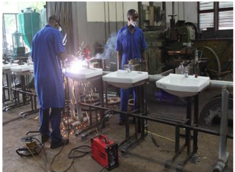
Wahandisi wa Chuo Kikuu cha Dar es Salaam wakitengeneza mashine maalumu za kunawia mikono