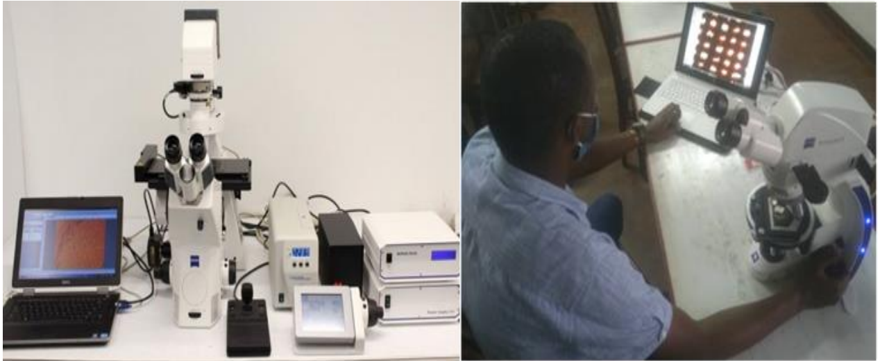
Darubini maalumu iliyopo Chuo Kikuu cha Dar es Salaam ya kupima ubora wa barakoa